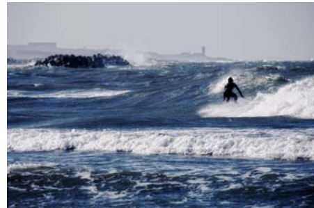
「真冬のサーファー」 蜘蛛 康介