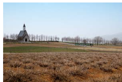
「五月上旬の牧歌の里」 蜘蛛 康介

5月21日(土)、広瀬城跡散策から桜野公園での懇親会という形で、ご夫人7名を含め総勢33名の参加による恒例の新緑例会が行われました。