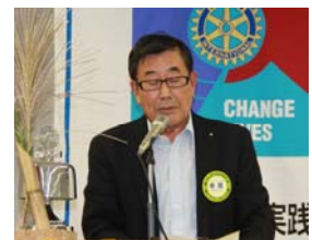
左記方針の推奨について