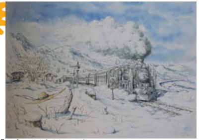
「おなじ星を見ていた - ギャリックスの架かる虹 -」より 汽車を待つ 内田 新哉